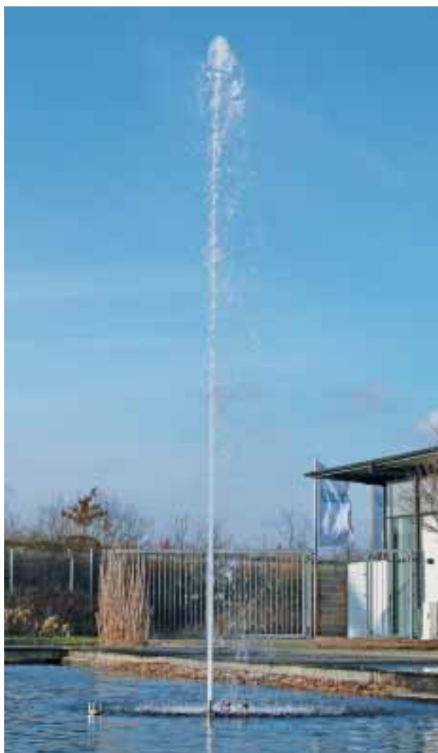
Cluster Eco 15-38